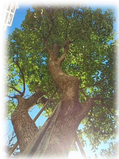
川崎市立川崎病院 シンボルツリー