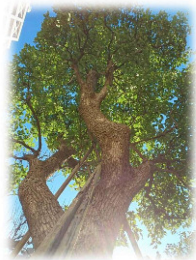
川崎市立川崎病院 シンボルツリー