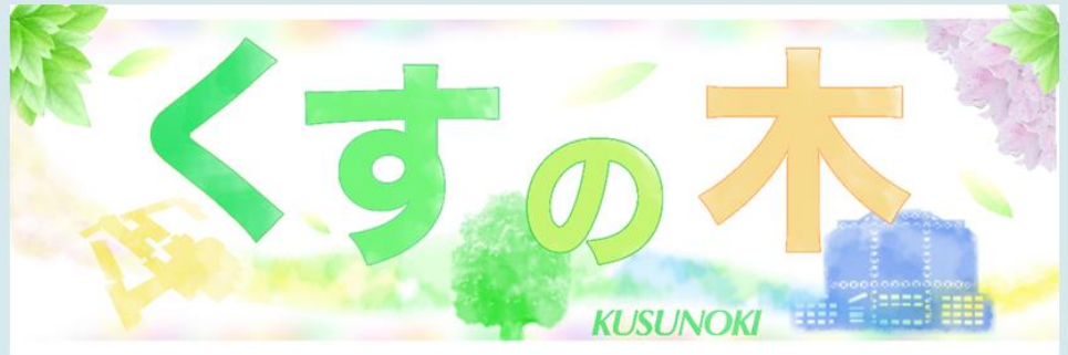
川崎市立川崎病院 シンボルツリー